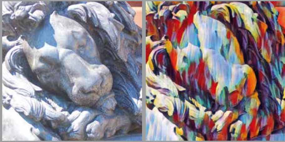
JULI // Löwe, Schloss Philippsruhe