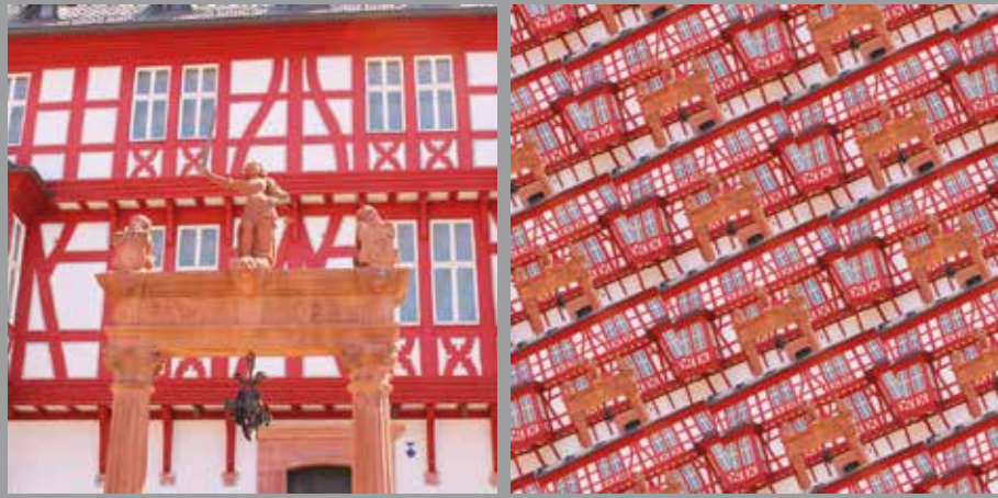
OKTOBER // Deutsches Goldschmiedehaus