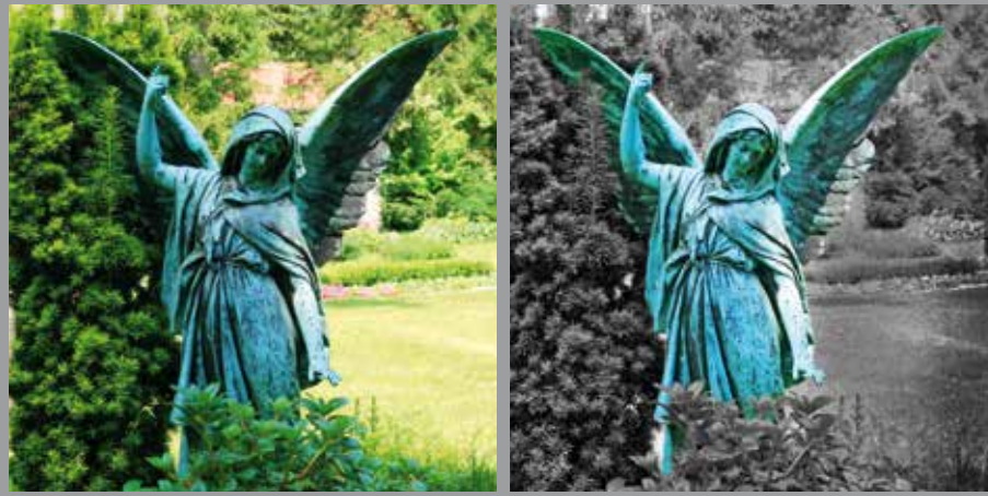
NOVEMBER // Engel, Hauptfriedhof