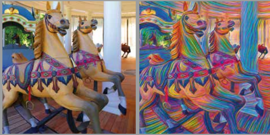
FEBRUAR // Karussell, Wilhelmsbad