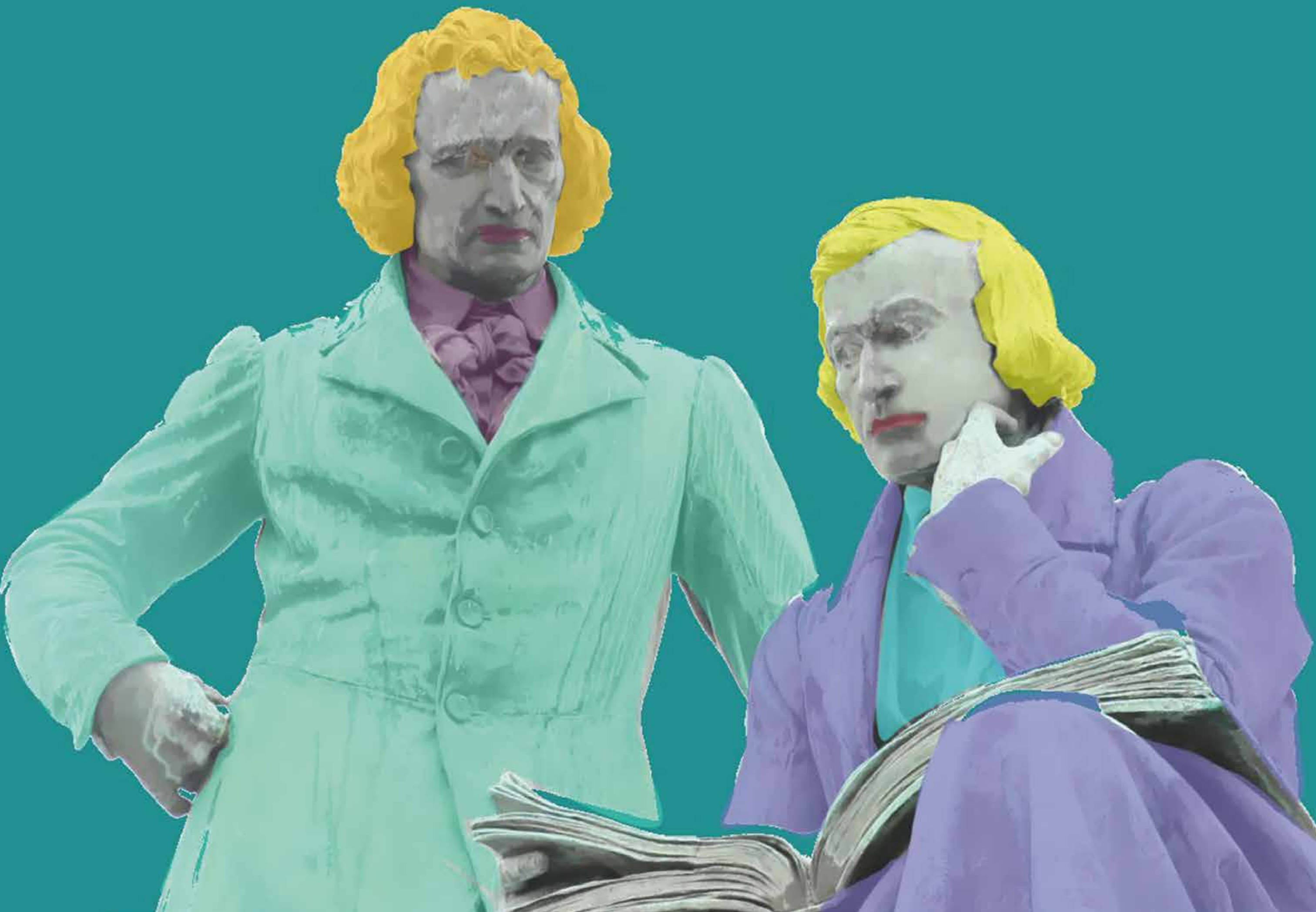
Brüder Grimm, Marktplatz