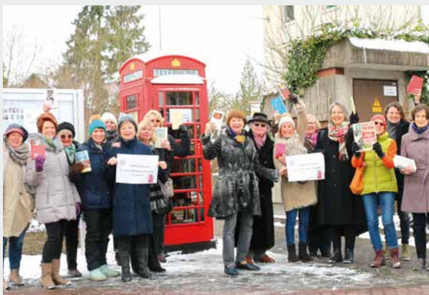
Mitglieder des Zonta Clubs Hanau vor dem Bücherschrank, März 2018

... und immer noch gern besucht: Die rote Telefonzelle an der Rosenau, ein öffentlicher Bücherschrank für alle, die neugierig sind, Lesestoff suchen und ein ständig wechselndes Angebot nutzen.