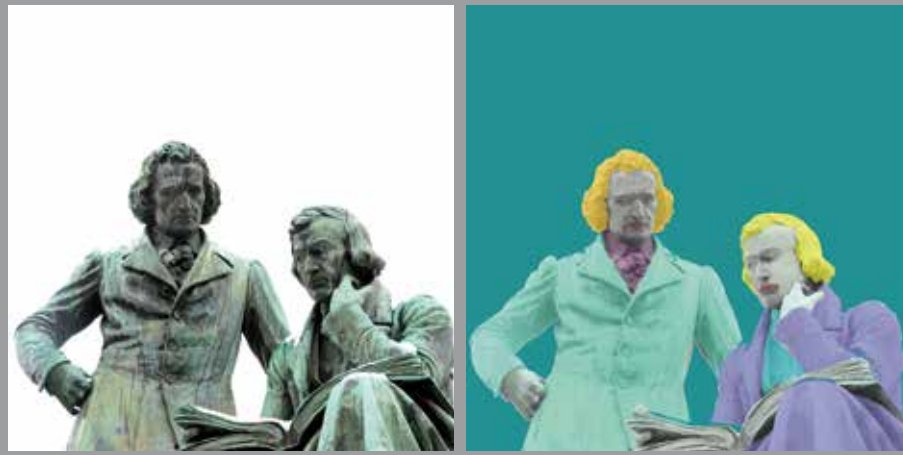
MAI // Brüder Grimm, Marktplatz