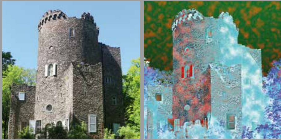
JANUAR // Burgruine, Wilhelmsbad