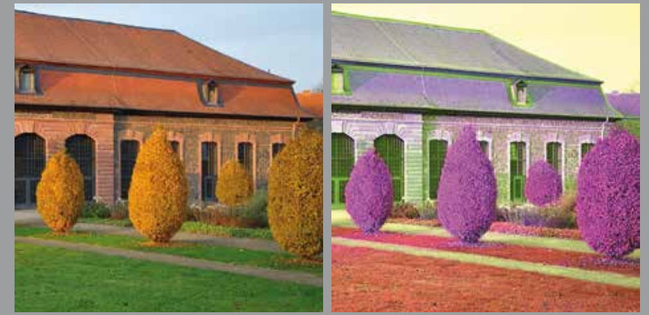
JUNI // Orangerie, Philippsruhe