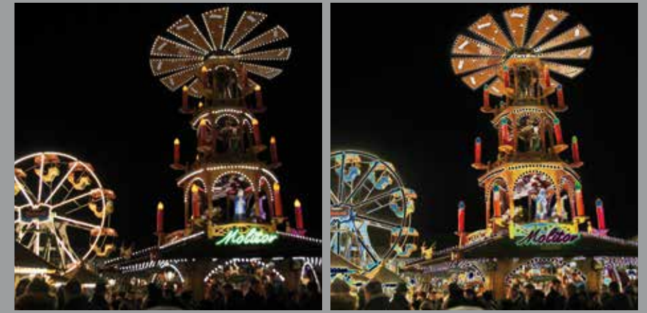
DEZEMBER // Hanauer Weihnachtsmarkt