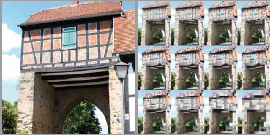
APRIL // Obertor, Mittelbuchen