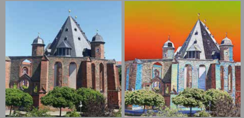
SEPTEMBER // Wallonisch-Niederländische Kirche