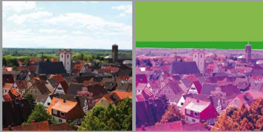
AUGUST // Altstadt Steinheim